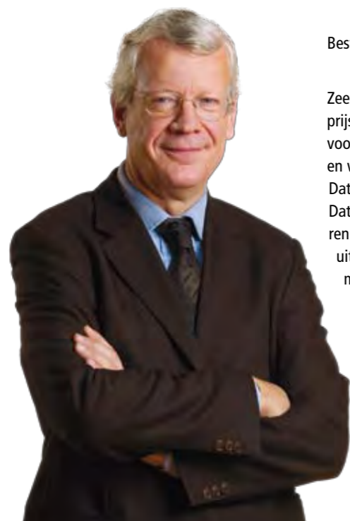
Lodewijk DE WITTE provinciegouverneur